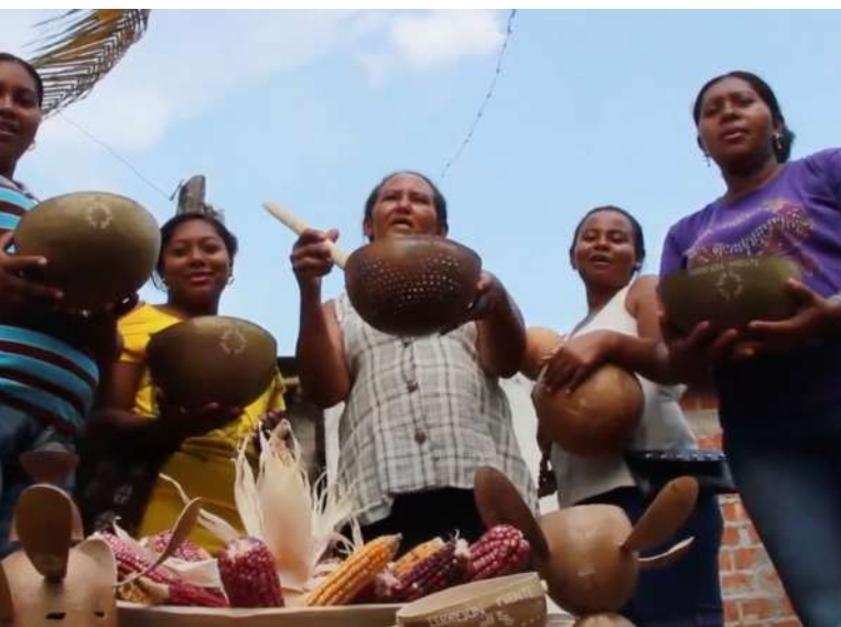
Fotograma de "Chiqui Chiqui. Cocineras ancestrales", guanyadora del Premi del Jurat Indifest 2020.

LA LUCHA SIGUE. VERDAD Y JUSTICIA PARA MÁRTIRES LÓPEZ (La Rastrijera y Pehuen Producciones, Qom, Argentina, 2015)