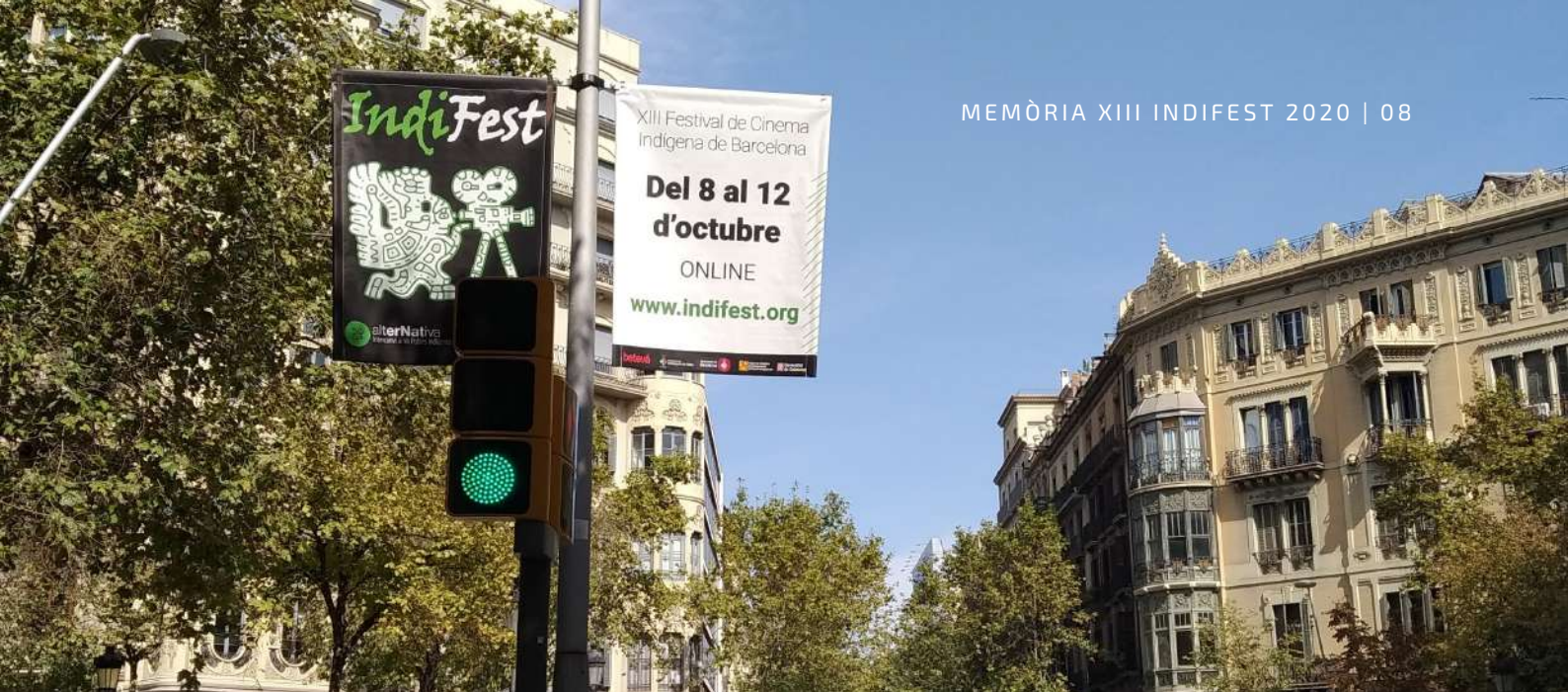
Banderoles al Carrer València de Barcelona